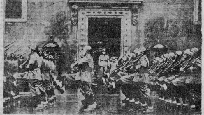
Frente al Duce, las legiones italianas desfilan al paso de parada alemán adoptado hace un tiempo. Estos regimientos que desfilan en Roma ante Mussolini, van a ser transportados inmediatamente a los centros de concentración en el norte, sobre la frontera de Francia y serán las fuerzas que choquen contra las de los Aliados en las regiones de los Alpes. La fotografía es de la última semana de mayo anterior.